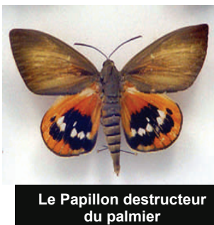
Le Papillon destructeur du palmier

On peut observer ce papillon en été, aux heures les plus chaudes de la journée, c'est un gros papillon aux ailes inférieures brillamment colorées d'orange, qu'il est obligatoire de détruire (classé organisme nuisible de lutte obligatoire). Les particuliers doivent donc détruire ce nuisible avec un traitement adéquate.